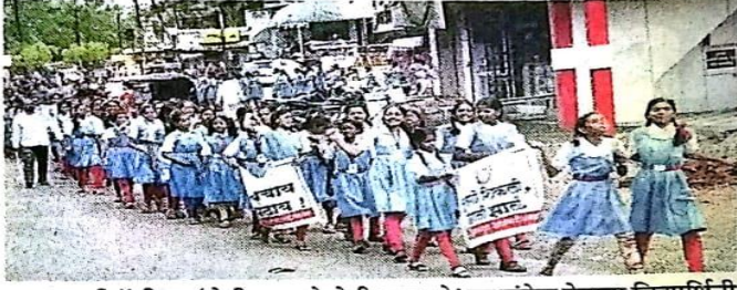
जनजागृती रॅलीतून 'बेटी पढाओ बेटी बचाओ' चा संदेश देताना विद्यार्थिनी